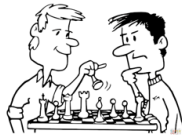
Chess (pleing ches) Jugar ajedrez