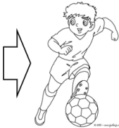
Soccer (pleing soker) Jugar fútbol