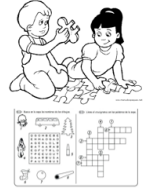
Puzzles (puzels) Rompecabezas