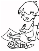
Drawing (draing) Dibujar