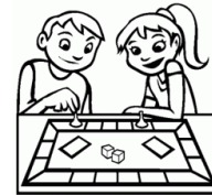
Table games (pleing teibol gueims) Jugar juegos de mesa