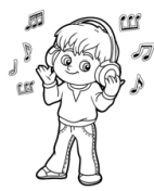
Listening music (lisening miusic) Escuchando música