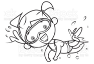
Swimming (suiming) Nadar