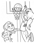
Basketball (pleing básketbol) Jugar baloncesto