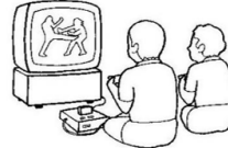
Videogames (pleing videogueims) Jugar videojuegos