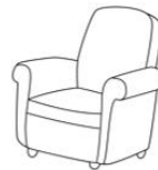
Arm chair (arm cher)