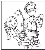
Dentist (déntest) Dentista