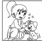
Vet (vet) Veterinario/a