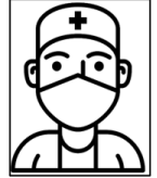
Doctor (Dóctor) Doctor/a