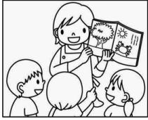
Teacher (ticher) Maestro/a

1 Highlight the vowels: a = red e = blue i = green o = yellow u = brown (jailait the vauels: ei = red, i = bluu, ai = griin, ou = yelou, iu = braun) Remarca las vocales: a = rojo, e = azul, i = verde, o = amarillo, u = café