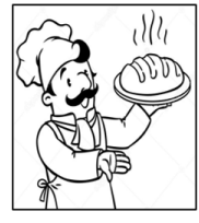
Cook (cook) Cocinero/a

2 I want to be a/an (Ai guant to bi a/an) Quiero ser un/una