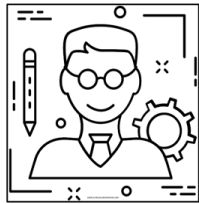
Engineer (enyiniir) Ingeniero/a