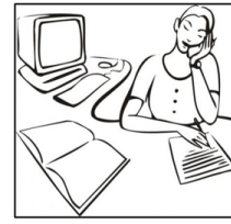
Secretary (sécretari) Secretario/a