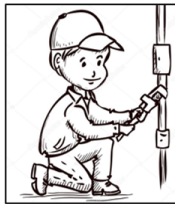
Plumber (plomer) Plomero/a