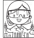
Scientist (saintist) Científico/a